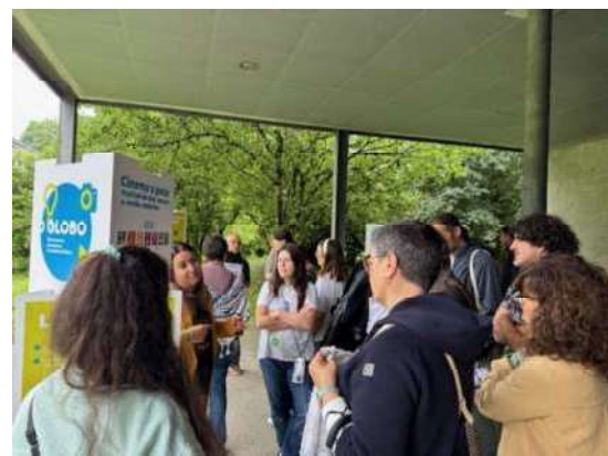
Feira de Microexperiencias de Transformación Social onde os colectivos presentaron as súas iniciativas.