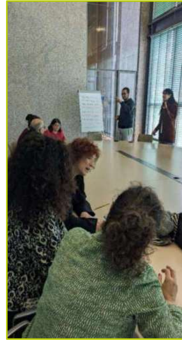
Obradoiros de Fotografía Participativa e Regueifa.