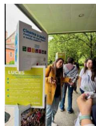
Feira de Microexperiencias de Transformación Social.